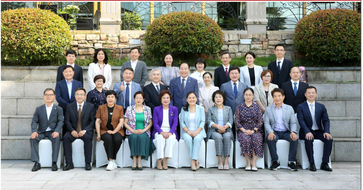
< 장가계시 방문 >