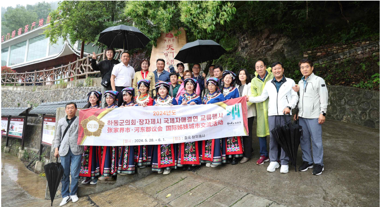
<장가계시 매차유한공사 방문 >

☑ 우리 차는 씻을 필요 없이 바로 찻잎 2~5g 찻잔에 붓고 90℃ 이상의 뜨거운물로 2~3분정도 우려면 됩니다. 차가 열어질때까지 2~3번 우려 드시면 됩니다.