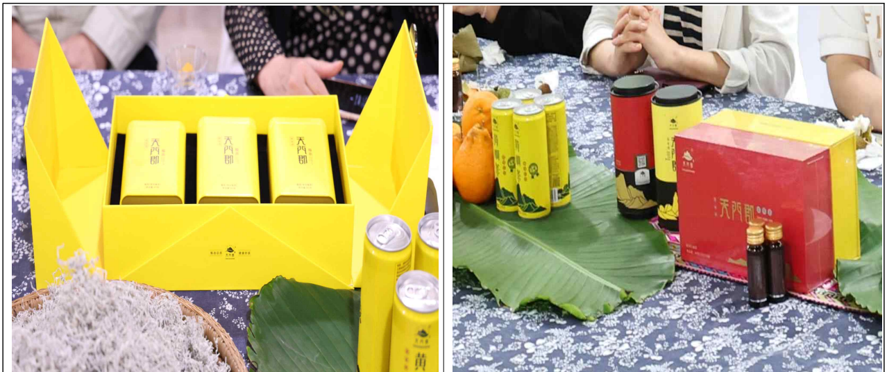
二产：产品阵容—六大莓茶系列+深加工产品阵容

매차에는 인체에 필요한 여러 아미노산과 성분을 함유하고 있어 관절염 예방, 기관지, 신장 보호, 면역력 강화 등에 효과가 있어 장가계 사람들은 평소 물처럼 마신다고 한다. 장가계에서 매차를 특산품으로 개발하기 위해 많은 지원을 하고 있으며, 우리 대표단이 방문한 장가계시 매차유한공사에서도 매차 대용차 등 많은 가공품을 개발하여 판매하고 있었다.