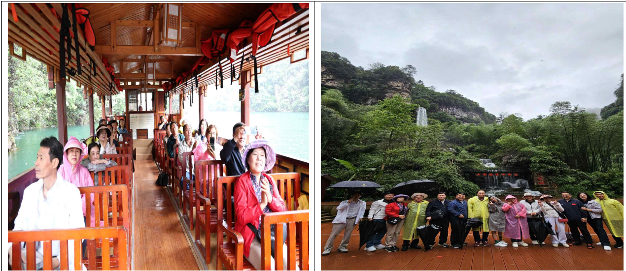
< 비취, 보봉호 탐방 >