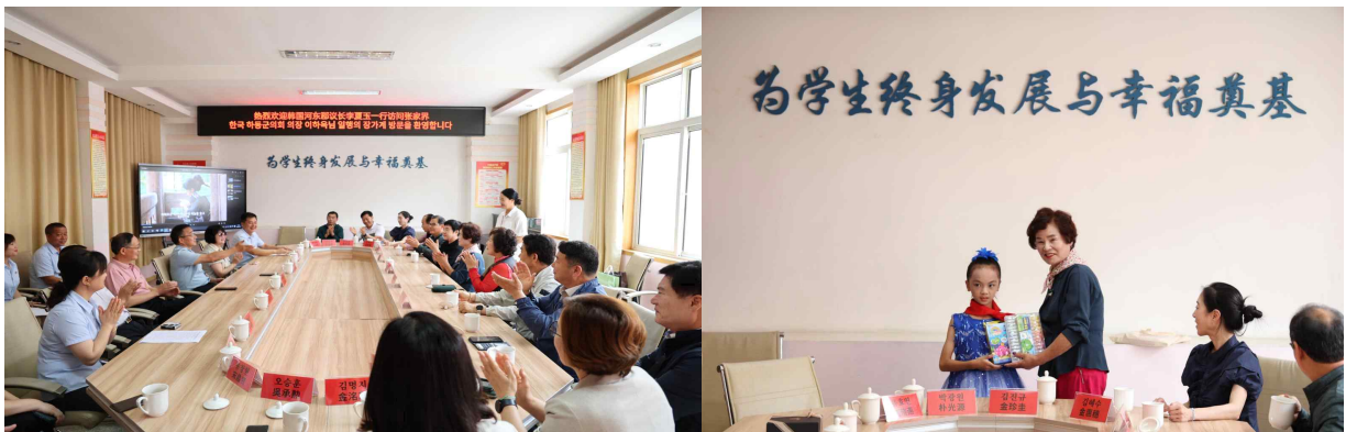
<송실초등학교 관계자 간담회>

☞ 문화교류활동을 통해 양 도시의 아이들이 양쪽 국가의 역사, 문화, 자연, 인문경관, 학습방식 등에 대해 많은 이야기를 나누게 됩니다. 이러한 활동을 통해 아이들은 학습시야를 넓히고 성장기 친구 관계를 형성하는 데 많은 도움이 됩니다.