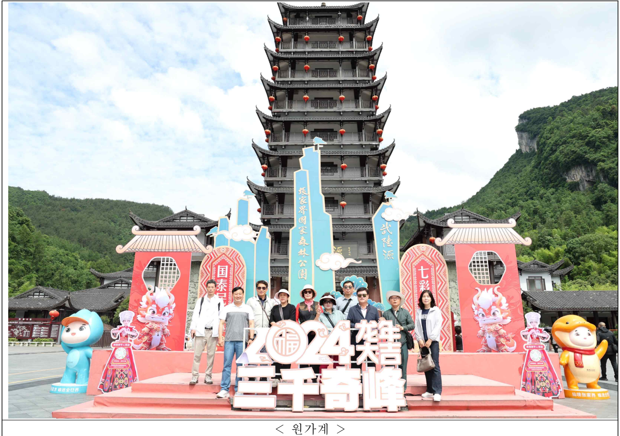
< 원가계 >

원가계는 중국 후난성 장가계에 위치한 무릉원 풍경구의 일부로, 장가계 국가삼림공원 내에 위치하고 있다. 원가계는 특히 영화 '아바타'의 촬영지로 유명해진 곳이며, 그 덕분에 세계적인 관광 명소로 자리 잡게 되었다. 이 지역은 약 3억 8천 년 전 해저였던 곳이 지각 운동을 통해 육지로 솟아오른 후 침식과 풍화 작용을 거쳐 현재의 웅장하고 아름다운 산수 경관을 이루게 되었다고 한다. 이곳은 자연 그대로의 모습을 잘 간직하고 있어 무릉원 풍경구의 핵심 관광지 중에 하나이고 독특하게 생긴 석영사암의 봉우리들이 관광객들을 압도한다. 그리고 등산로 곳곳에 있는 쓰레기통과 청소부가 등산로에 상주하고있어 많은 관광객들이 찾는 곳이었지만 바닥에 버려진 쓰레기를 찾아볼 수 없을 정도였다. 이러한 관광지 청결은 관광객들로 하여금 많은 민원을 유발하는 원인