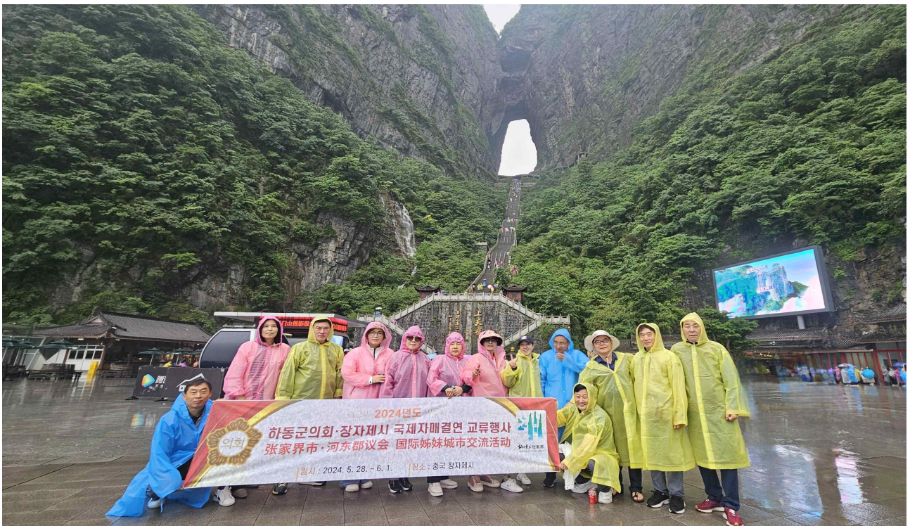
< 장가계 천문산 >

우리군도 지리산, 금오산, 한려해상 등 자연경관을 활용한 관광상품 개발과 다양한 레저시설 조성 등을 통해 관광객에게 많은 볼거리와 체험거리를 제공하고 관광객들의 다양한 니즈를 반영할 수 있는 관광마케팅 전략 수립이 필요해보임.